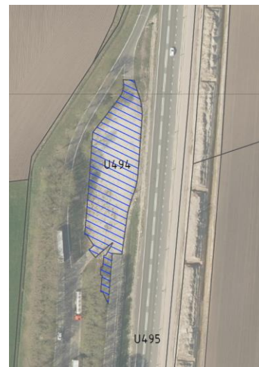
te verhuren perceel ten behoeve van het tankstation.